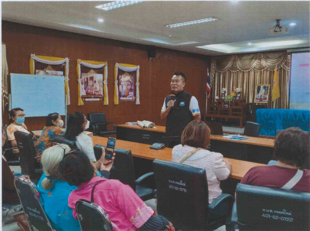
การประชุม อถล. เพื่อคัดเลือกคณะกรรมการเครือข่ายอาสาสมัครท้องถิ่นรักชาติโลก (อถล.)